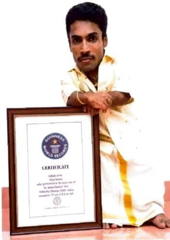
Ajay Kumar (Guinness Pakru) Actor